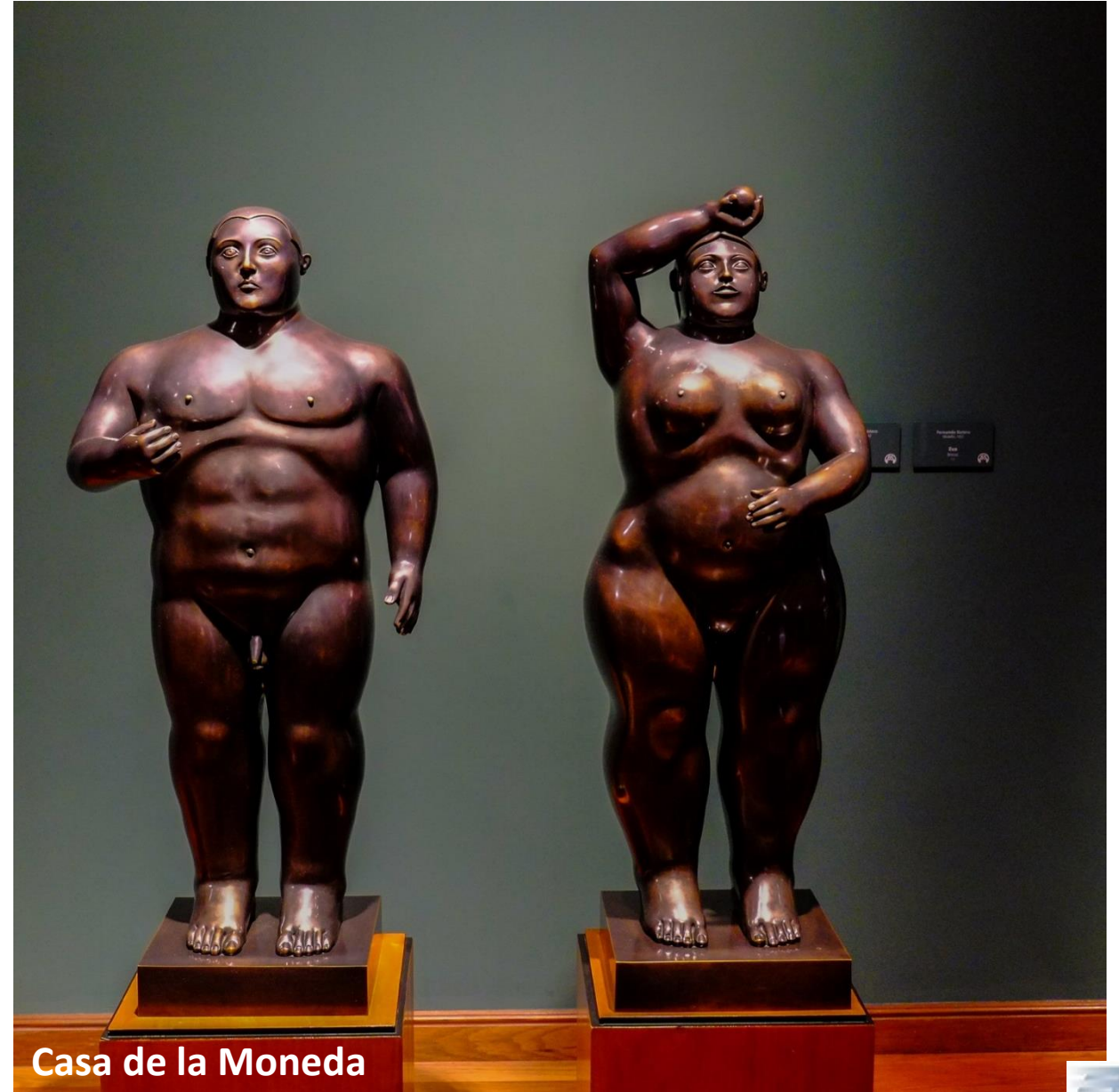
Casa de la Moneda